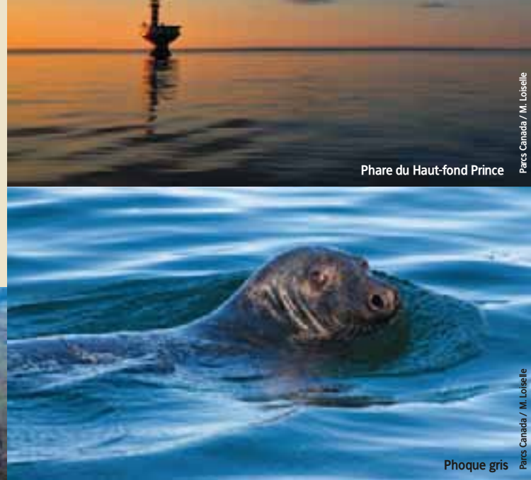
Phare du Haut-fond Prince

Le maintien de la biodiversité, la protection des écosystèmes et la mise en valeur des composantes naturelles et culturelles du territoire sont les principaux objectifs du parc marin du Saguenay–Saint-Laurent. L’état du parc marin est intimement lié aux activités humaines pratiquées sur son territoire et dans les bassins versants du Saguenay et du Saint-Laurent. Votre participation à la protection des écosystèmes marins est donc essentielle au succès de l’aire marine.